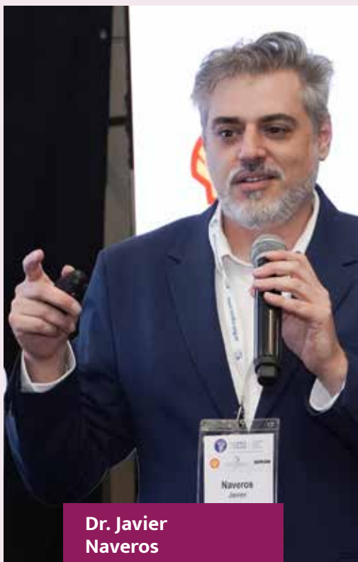
Dr. Javier Naveros

EX DIRECTORA DEL INSTITUTO NACIONAL DEL CÁNCER