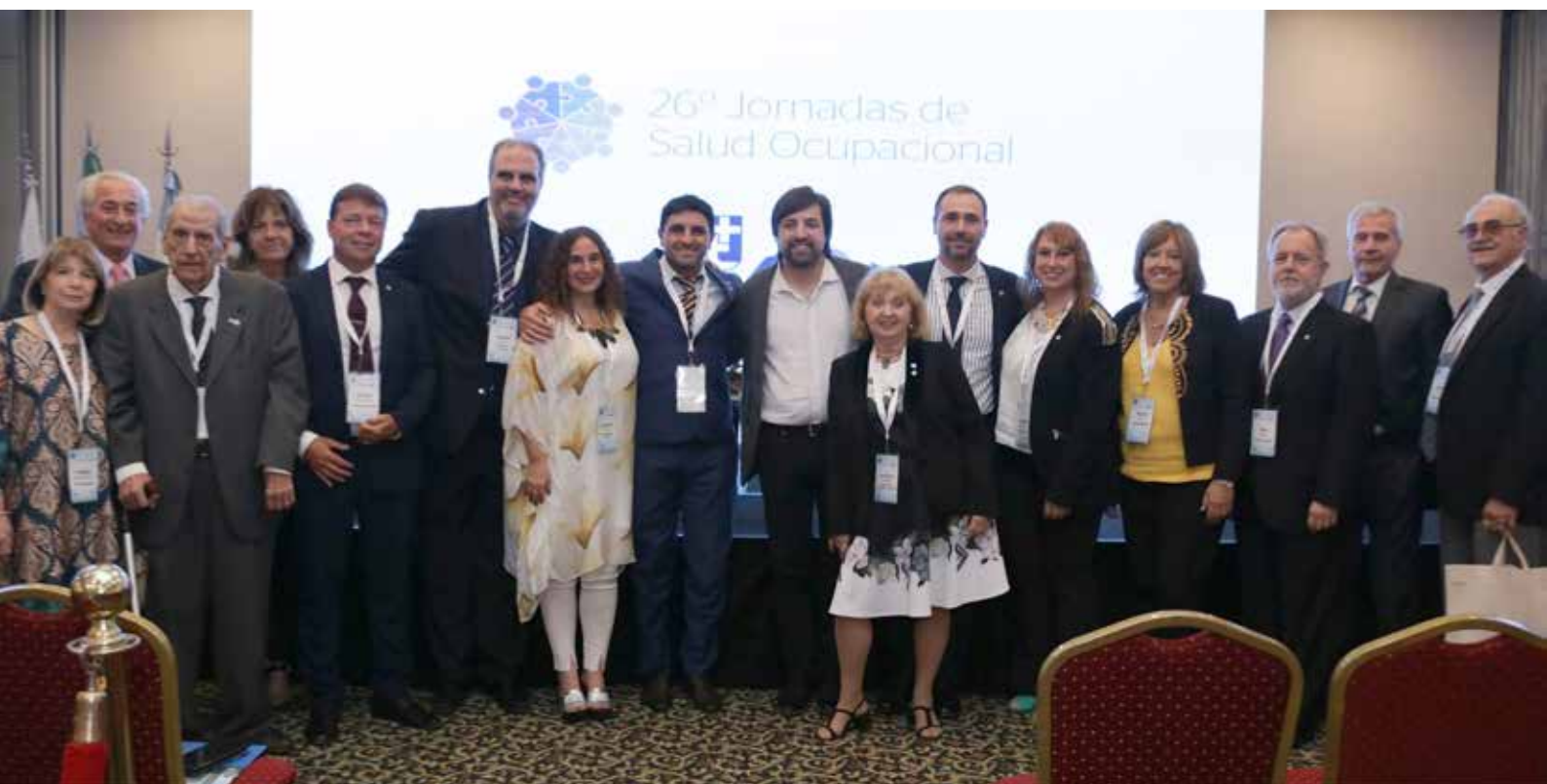
Comision Directiva y Tribunal de Honor de la SMTBA junto al Ministro de Salud de la Provincia de Buenos Aires

El Simposio de Ausentismo, momento ya clásico en las Jornadas, se presentó en su cuarta edición, destacando temas vinculados a la deontología y la praxis médica, desde la palabra y consideración de especialistas en el área.